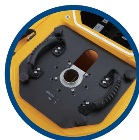
Монтажное отверстие для датчиков