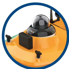
Защита от столкновений