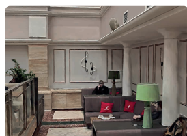
Дизайн интерьеров и реконструкция