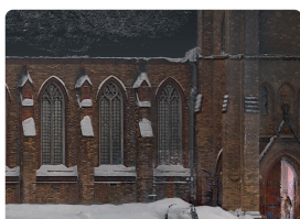
Архитектурные обмеры и обследования