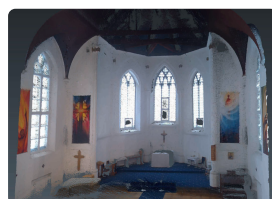
Культурный туризм и сохранение исторического наследия